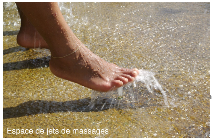
Espace de jets de massages