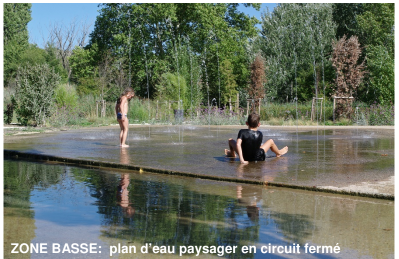
ZONE BASSE: plan d'eau paysager en circuit fermé