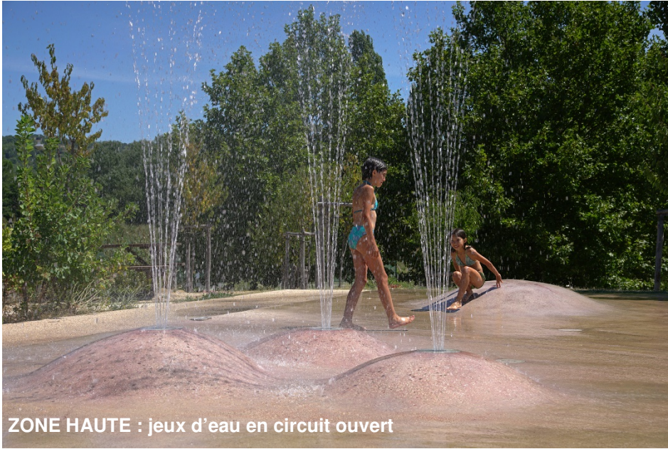
ZONE HAUTE : jeux d'eau en circuit ouvert

Le parc est constitué d'une partie haute ou des jeux d'eau en circuit ouverts servent à constituer les réserves pour l'espace paysager et pour la citerne d'arrosage.